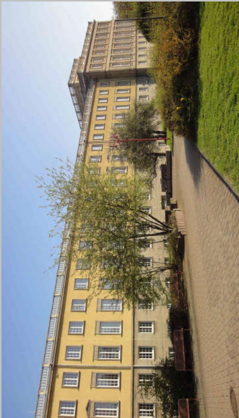
Campus Jahnallee Haus 3 Seminarraumgebäude Erziehungswissenschaften